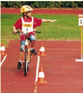
Aufgabe 6 SPURWECHSEL Umschauen, die angezeigte Zahl merken und Handzeichen geben.

Auf einem Parcours mit acht Aufgaben (vgl. Abbildungen) können die Kinder spielerisch wichtige Fahrtechniken, die sie im Straßenverkehr sicher beherrschen müssen, einüben. Beim abschließenden Turnier können sie dann ihr Fahrkönnen testen. Außerdem werden zu Beginn die Fahrräder der Teilnehmer auf Verkehrssicherheit überprüft.