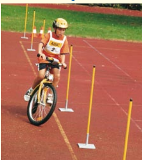
Aufgabe 7 SLALOM Keine Stange berühren oder auslassen!