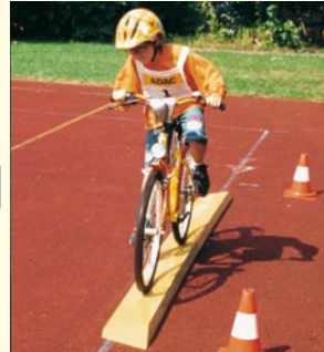
Aufgabe 5 SCHRÄGBRETT Nur nicht vom Schrägbrett abrutschen!