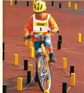
Aufgabe 4 ACHTER Kein Klötzchen umstoßen und nicht aus der Spur fahren!