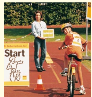
Aufgabe 1 ANFAHREN Erst genau nach links umschauen, dann anfahren.

Ganz wichtig: Möglichst nicht stehend fahren und vor allem nicht abstützen, ausgenommen nach dem Anhalten im »Ziel«.