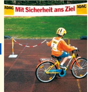
Aufgabe 3 KREISEL Mit der Kette in der linken Hand einen Kreis fahren!