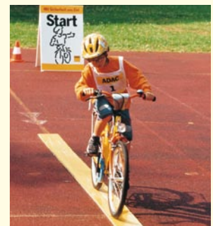
Aufgabe 2 SPURBRETT Nicht vorzeitig vom Spurbrett fahren!