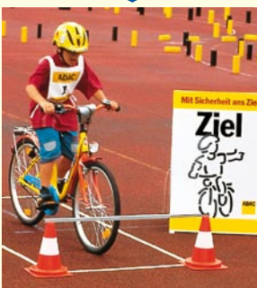
Aufgabe 8 BREMSTEST Vor der Stange anhalten und dann abstützen!